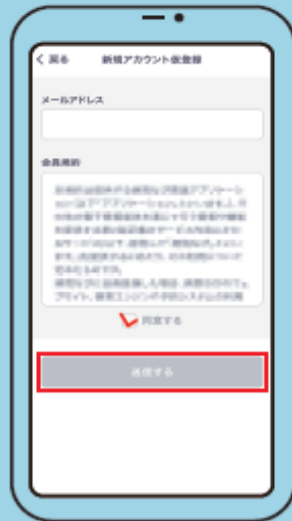
② 新規アカウント仮登録 メールアドレスを入力し、 会員規約を必ずお読みの上、 「同意する」にチェックを入れて送信