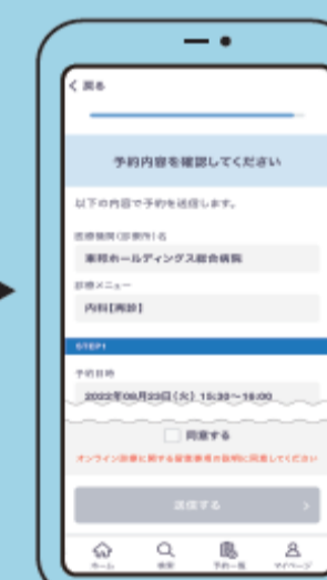
⑰ 予約内容の確認 利用規約に同意の上、「送信する」