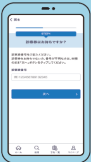
⑪ 診療券番号の入力 お持ちの方は診療券番号を入力