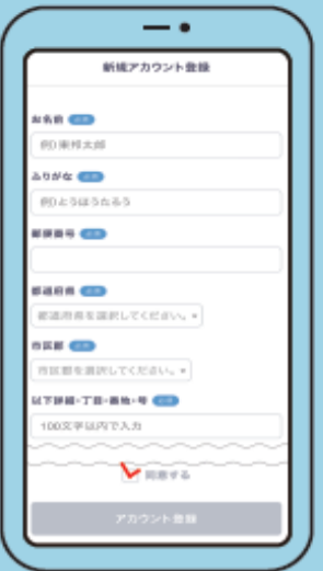
④ 新規アカウント登録 各情報を入力し、会員規約を 必ずお読みの上、「同意する」に チェックを入れて送信