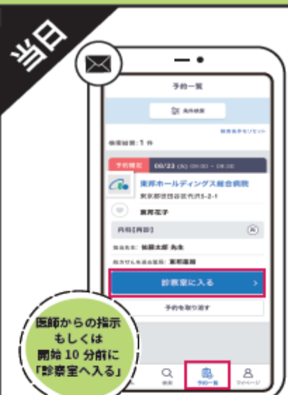
⑱ 診療ルームへの入室 診察時間が近づきましたら、 メール内のZoomURL、 もしくは予約一覧の「診察室に入る」 ボタンを押すとZoomアプリが起動