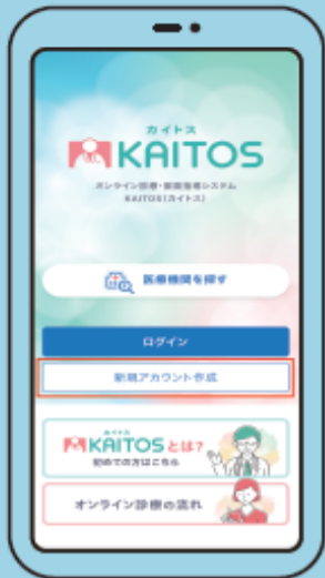
① 新規アカウント作成