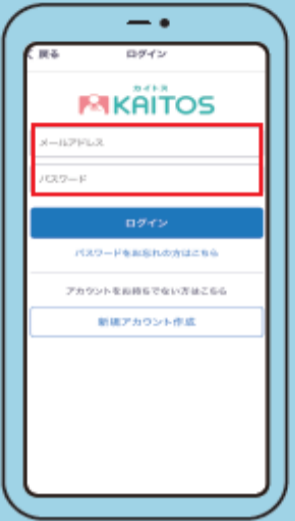
⑧ ログイン 新規アカウント登録で 登録したメールアドレスと パスワードを入力し「ログイン」