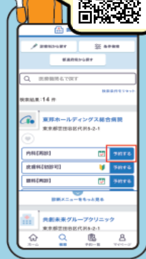
⑤ 診療メニューを選択 当院のQRコードを再読み込み 診療メニューを選択し「予約する」