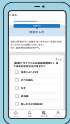
⑫ 問診票の入力 全項目の入力が必須 ※問診票が表示されない場合があります