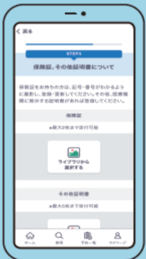
⑭ 保険証・その他証明書のアップロード 保険証等がある場合は登録