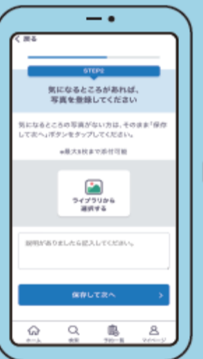
⑬ 画像のアップロード 志部画像がある場合は登録