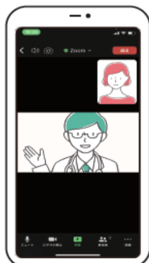
⑲ ビデオ診療開始 先生と映像・音声繋がりが ましたら診察を開始 診察が終わりましたら 「退出」ボタンを押して診察を終了