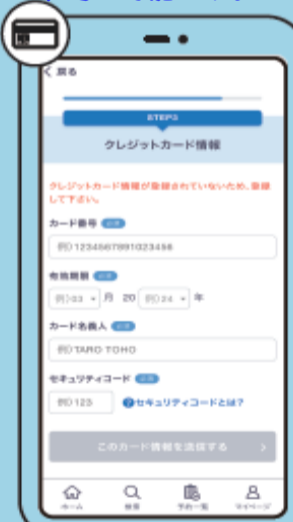
⑮ クレジットカードの登録