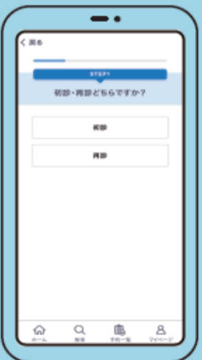
⑩ 初診・再診の選択 当院は再診の方のみ、 申込が可能です。