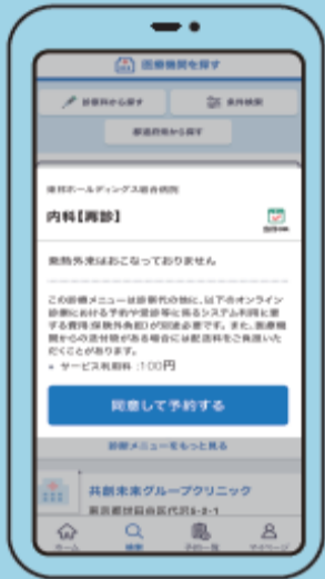
⑥ 予約内容の確認 診療メニューの内容に同意し、 「同意して予約する」を選択